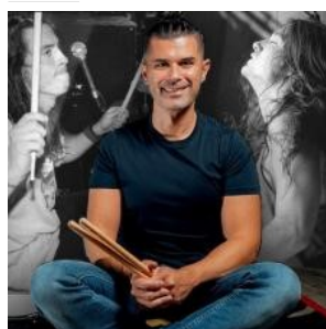
I grandi batteristi dell'epoca Grunge