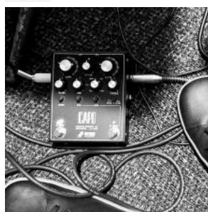
CAPO: preamp per basso definitivo?