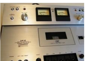
AKAY GX3 310 D