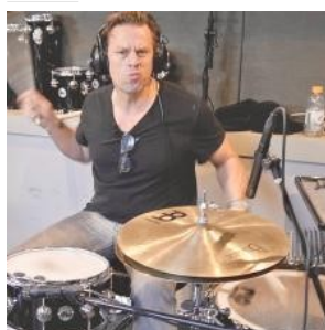
Thomas Lang: Traditional Grip Vs Match Grip