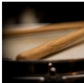
Batteria: scegliere la bacchetta perfetta