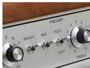
Il controllo del tono del Dumble Overdrive Special anni '60