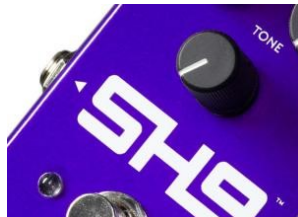
SH9: Scott Henderson signature dal creatore del Tube Screamer