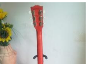
gibson les paul tribute