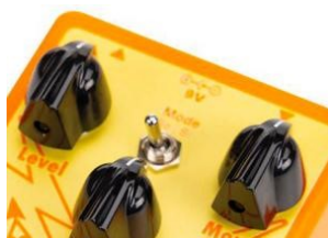
Special Cranker: un overdrive di cui fidarsi