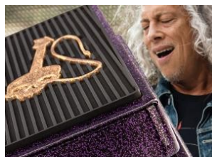
Il Cry Baby signature di Kirk Hammett è realtà