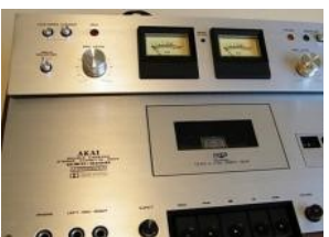
AKAY GXC 310 D