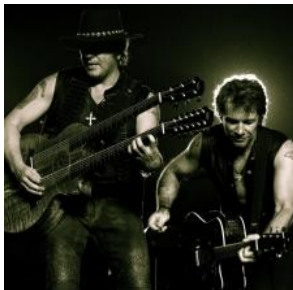
Bon Jovi, l'armonia e i mostri dello studio