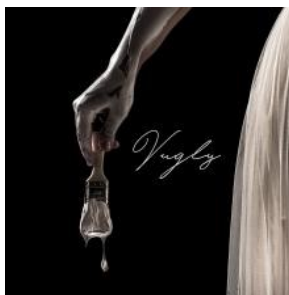
Basso e voce hanno infinite possibilità