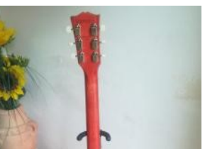
gibson les paul tribute

Questo sito deve far uso di cookie tecnici,