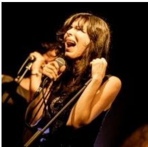
Canto: lo strumento voce