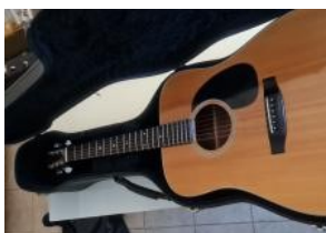
Takamine G330 lawsuit