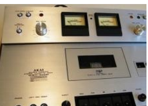
AKAY GXC 310 D